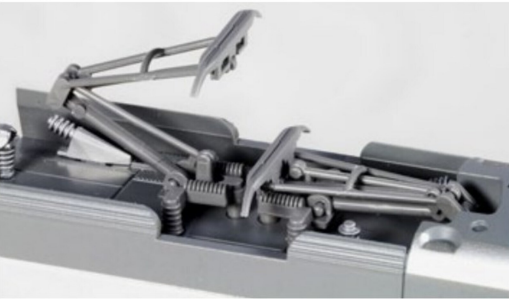
Feine Pantografen aus Kunststoff.