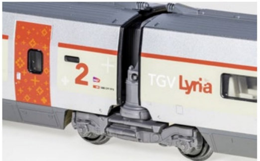
... zum «Augenspaziergang» einlädt.