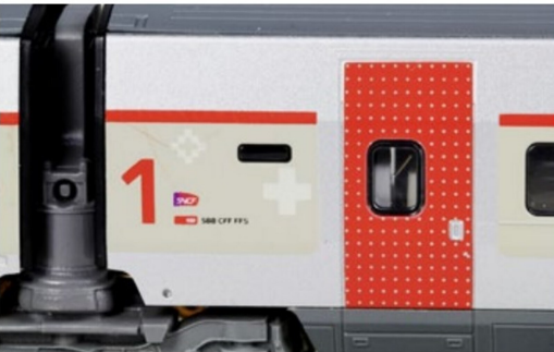
... die beachtliche Druckqualität, die ...