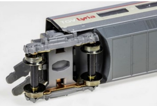
Hobbykollegen, die auf Arnold-Gleismaterial ...