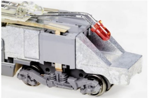
Pfiffige Art der Fahrstromaufnahme.