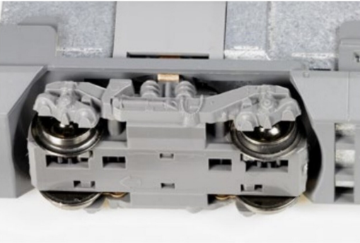
Eines der beiden Antriebsgestelle.