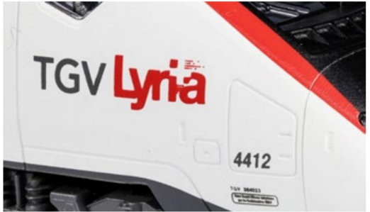
Ebenfalls neu beim Kato-TGV ist ...