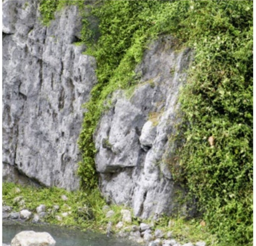
Zwei Hartschaumstücke von Noch bilden hier einen steilen Abhang hinunter zu einem Bach in einer Szenerie in HO.