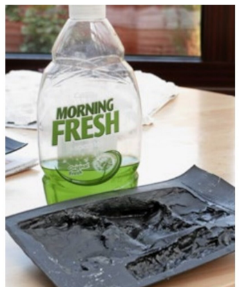
Bevor man das Pulver für die zu gießende Felsmasse mischt, wäscht man mit Vorteil die Gummiform mit Wasser und etwas Zugabe von Waschmittel. Das hilft, Luftblasen an der Oberfläche zu vermeiden.