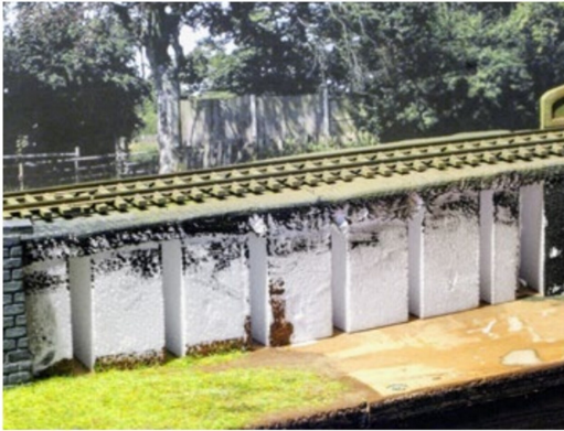
Diese Lücke in der Gestaltung wurde in 15 Minuten mit Hartschaumfelsen aufgefüllt.