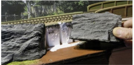
Mit Weissleim wurde der Grund eingestrichen, und die Hartschaumstücke wurden eingedrückt.