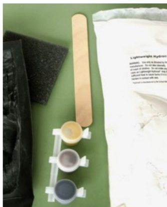
Die Teile im Probiereset für den Felsenbau: Gummiform, drei Farben mit einem Schaumgummistück für den Farbauftrag, eine Tüte mit Hydrocal (Gips) und ein Holzstäbchen für die Mischung von Pulver und Wasser.