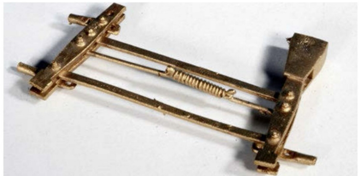
Gussteil für die Bremsschere.