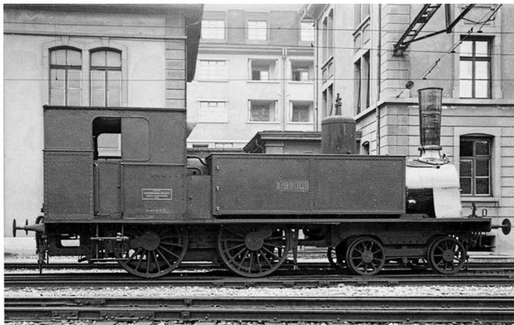
... Heizwagen Xd 99009 ex. SBB Nr. 5459 in Basel 1933.

Im abschliessenden 4. Teil werden wir uns der einzig noch erhaltenen Lok, der historischen Jura-Simplonbahn Eb 2/4 Nr. 35 (SBB 5469) widmen und deren Aufarbeitung durch die Dampfgruppe Balsthal etwas näher beleuchten.