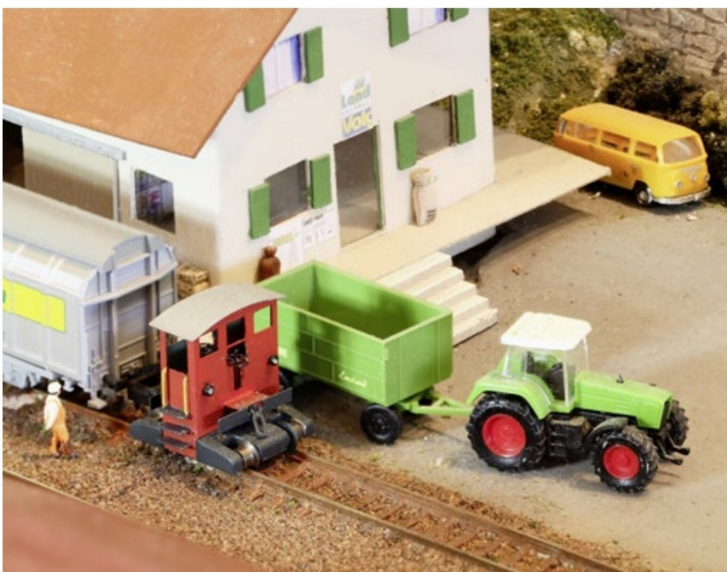
Zwei Traktoren: Der Grüne von Fendt, der Braune von Breuer.