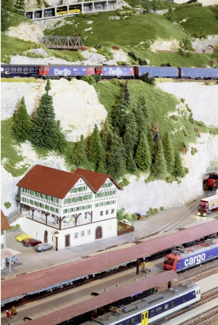
Hoch, höher, noch höher – wesentliche Attribute einer Gebirgs-Anlage.