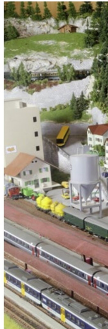
Viel Betrieb auf Schienen, Strassen (und Gewässern).