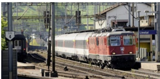
Doppeltraktion vor dem Interregio in Liestal: Während die Vorspannlokomotiven Re 4/4 11136 am seitlichen Rahmen mit der Bezeichnung Re 420 91 85 4 420 136-4 CH-SBB versehen ist, kommt Re 4/4 11300 (noch) ohne diese ausführliche Nummerierung aus.