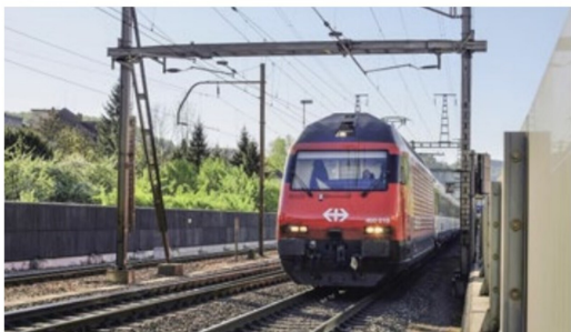
Die Re 460 016 ist bereits aus dem Refit-Programm in Yverdon zurück und verkehrt hier Richtung Olten noch neben dem 750 mm Gleis der WB bei Liestal.