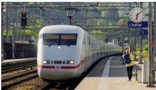
Ungewöhnlich ist das Zugangebot kurz nach 18:00 Uhr in Liestal: ICE 371 verkehrt als (fast ganz) Innerschweizer Zug zwischen Basel Badischen Bahnhof und Interlaken Ost und hält damit planmässig in Liestal.