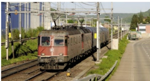
Geballte Kraft am kurzen Güterzug: Für die beiden Loks Re 6/6 11643 «Laufen» und 11614 «Meilen» dürfte die Last am Zughaken ein Kinderspiel gewesen sein.