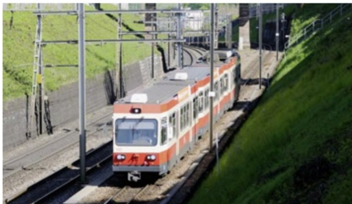
Die Jahre der Bahn ins Waldenburgerthal mit 750 mm Spurweite dürften gezählt sein.