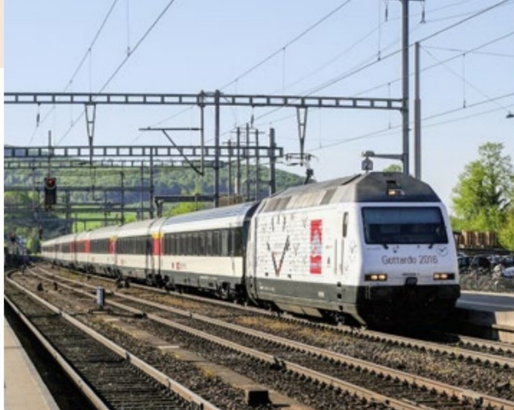
Es ist soweit: Die Inbetriebnahme des Gotthard-Basistunnels steht an. Re 460 044-1 weist auf dieses Jahrhundertereignis hin!