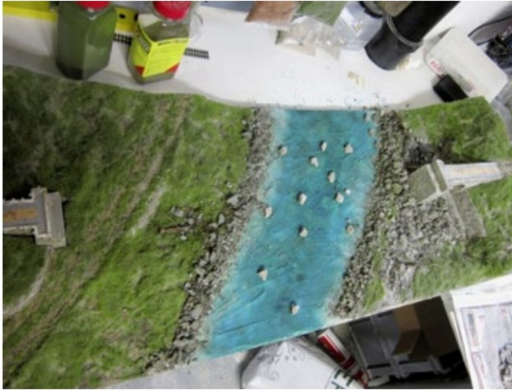
Uferböschung: Steinstücke und Kies, sowie erste Gräser sind aufgeklebt.