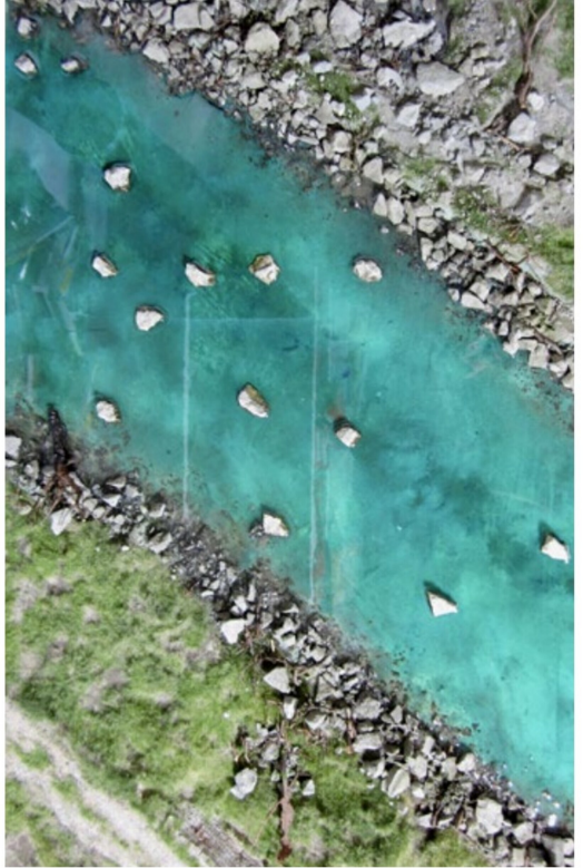
Zweikomponenten-Giessharz (ich verwendete das Produkt von Heki) wird in den Flussbereich gefüllt. 5 bis 10 Millimeter reichen in den meisten Fällen.