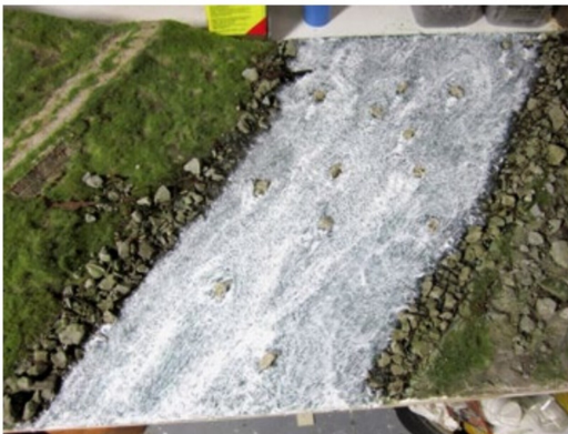
Mit Acrylbinder aus dem Künstlerbedarf werden die Wellen gebildet; zur Wellengestaltung helfen Bilder der Originalszenerie.