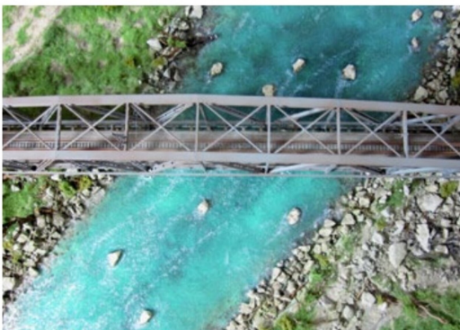
Die Brücke wird eingebaut, die Schienen eingeschottert. Nun ist die Szene bereit für die abschliessenden Feinarbeiten.