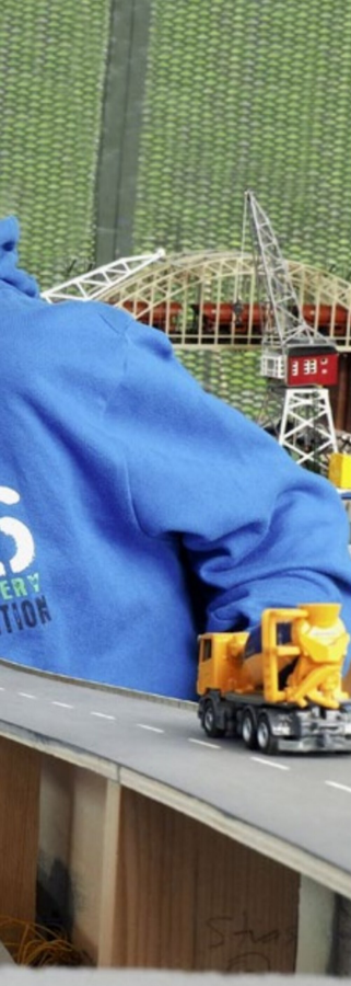
Oben: Simon (9 Jahre) fährt am liebsten mit modernen Zügen, die vordere der beiden El 14 des staatlichen schwedischen Güterunternehmens Green Cargo hat er sich selber zusammengespart.