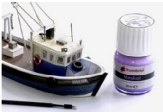
Mit Humbrol Maskol wurden Teile abgedeckt für die Anbringung des Mattlackes.