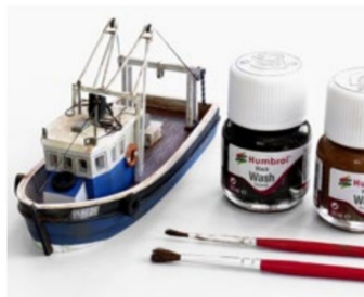
Das ganze Boot wurde verwittert, Rost ist auf Schiffen allgegenwärtig!