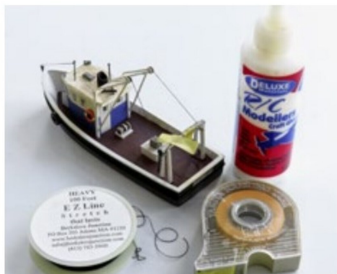
Zusätzliche Details wurden angebracht, was eine persönliche Note des Schiffes ergab.