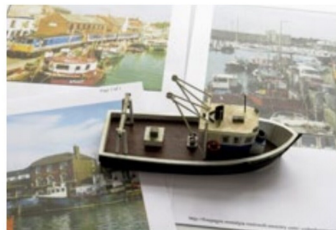
Recherche von ähnlichen Booten zur Anregung der Gestaltung.