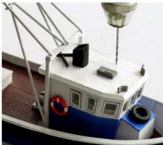
Mit einem kleinen Bohrer wurde ein Loch ins Dach gebohrt für die Anbringung eines Zusatzmastes.