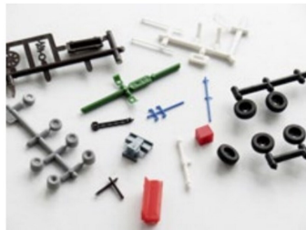
Überschüssige Kunststoffteile aus meiner Bastelbox für noch mehr Details.