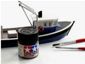
Der erste Schritt der Superung war die schwarze Farbe im oberen Teil des Rumpfes.