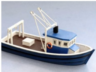
Frisch aus der Schachtel präsentiert sich das Bachmann-Produkt als sauberes Fischerboot.