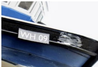
Die Nummer wurde vorne auf den Rumpf des Schiffes geklebt.