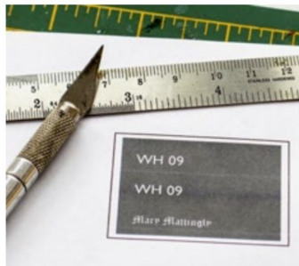
Name und Schiffsnummer wurden aus dem PC und dem Printer erzeugt.