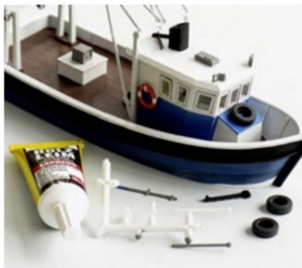
UHU Holzleim eignete sich gut für die Anbringung der Zusatzteile.