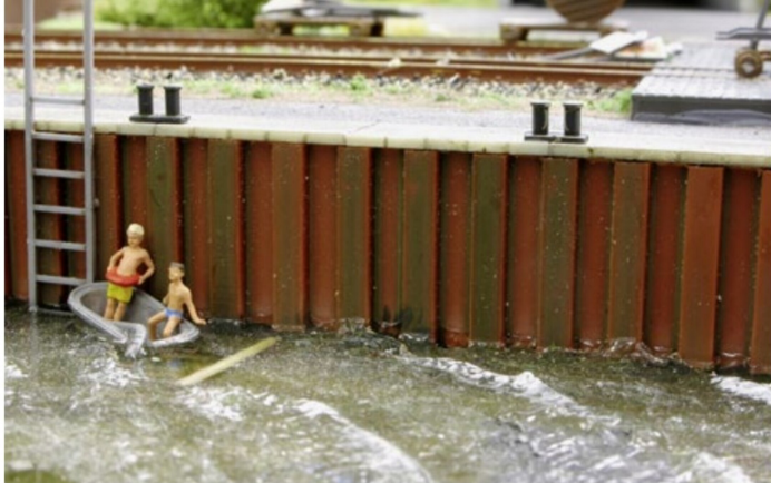
Aus einem Kit von Faller entstand diese Szene einer Hafenmauer.

Alle diese Mauerteile sind bereits verwittert mit dem bekannten Grüneffekt mit Algenbewuchs im unteren Teil. Das hier vorgestellte Diorama wurde in etwa 25 Stunden hergestellt, verteilt auf drei Wochen.