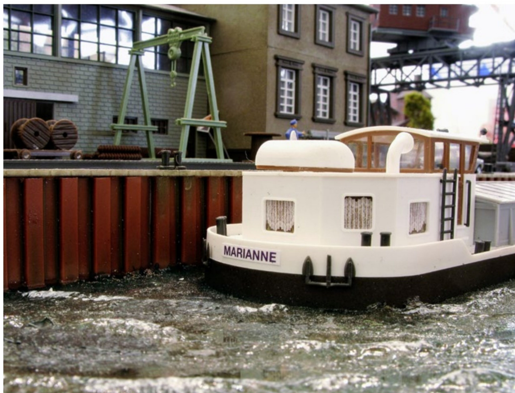
Eine Lastschiffszene von Faller mit richtig verwitterten Mauerteilen.