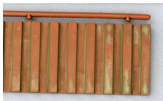
Detail der Kaimauer von Faller, richtig verwittert.