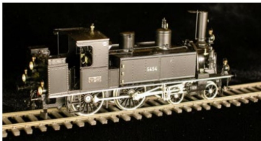
... den J.B.L.-Typ der 3. Lieferung ...