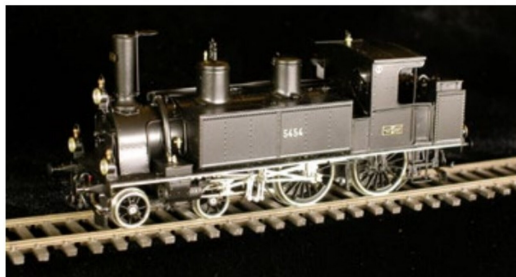
Dieses Modell aus Spiez dokumentiert ...