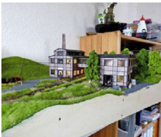
Mittlerweile sind auch die Begrünungsarbeiten recht weit fortgeschritten.