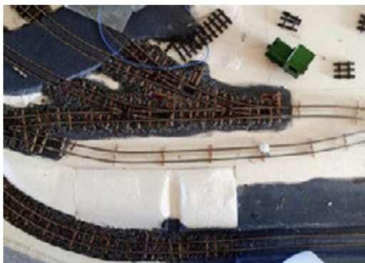
Ein Blick auf die halbfertige Ausweichstelle auf dem Fabrikmodul.