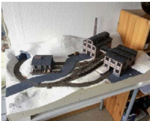
Gleisanlage und Rohlandschaft sind fertig. Nun kann es ans Begrasen gehen.