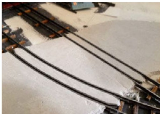
Mit dem Gipsauftrag wird ersichtlich, wozu «Rillenschienen» dienen.