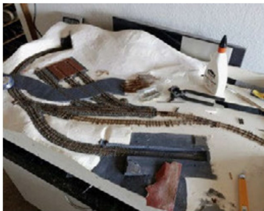
Bereits sind die Gleisarbeiten abgeschlossen, die Pause also redlich verdient.