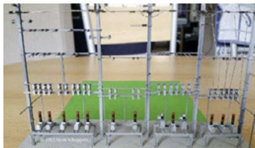
Blausee hat vier Felder, bei einem sind bereits Speiseleitungen montiert.