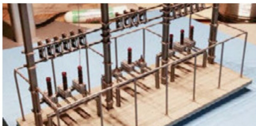
Und hier noch alle drei Felder mit sämtlichen Kästen und Fernschaltern.