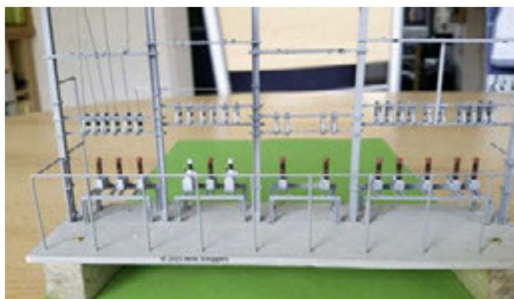
Die überzeugende Wirkung beginnt sich nach der Lackierung abzuzeichnen.