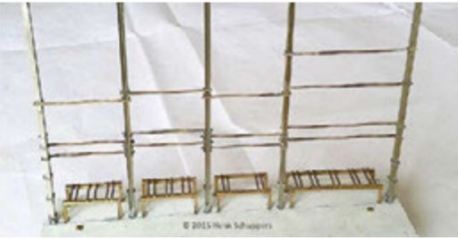
Posten Blausee-Mitholz mit den U-Profilen zur Aufnahme der Halterungen.