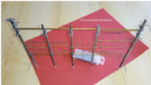
Halterungen für Isolatoren und Schalter sind aus Nickelsilberdraht 0,45 mm.