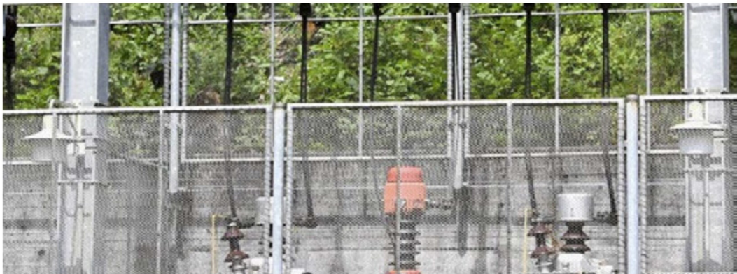
Zum Vergleich eine (von BLS Netz AG) genehmigte) Detailaufnahme vom Schaltposten Blausee-Mitholz mit der im Text erwähnten Beleuchtung im Schaltfeld 2.