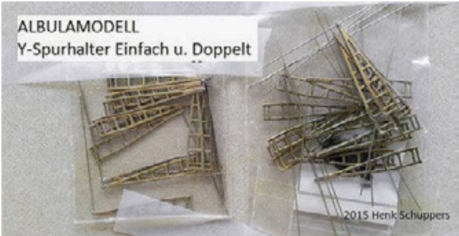
Eigentlich verwendet Henk die Y-Spurhalter von Albulamodell, doch für Ausserberg waren sie zu lang.