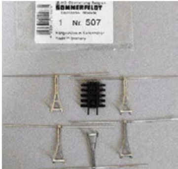
Die Y-Spurhalter im Programm von Sommerfeldt.