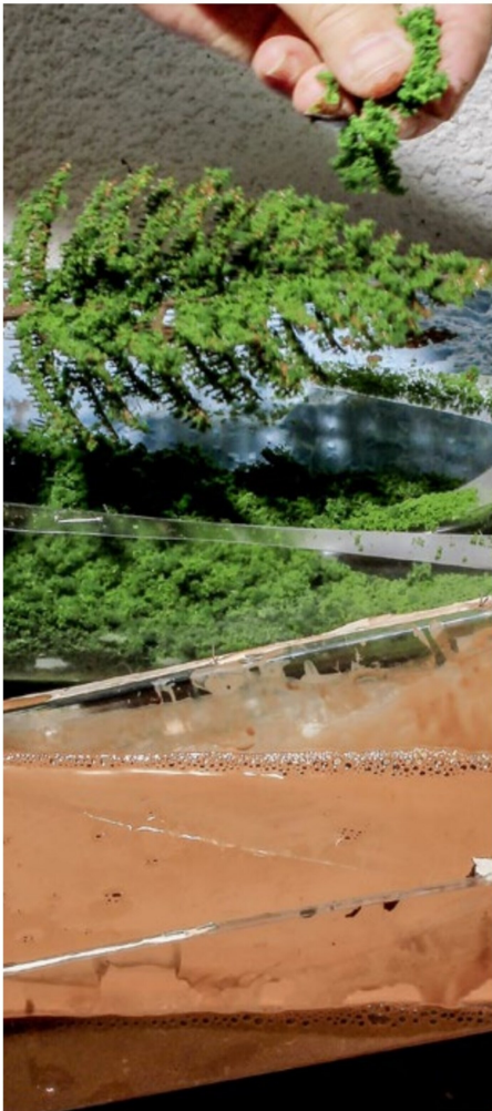
In den Leim fallen die Flocken.

Handarbeit auf jeden nur denkbaren Kundenwunsch abgestimmt und das in einem hervorragenden Preis-Leistung-Verhältnis! Kein Modell gleicht dem nächsten. Basis des Baumes ist verdrehter Draht der mit einer Borkenpaste überstrichen ist. Für die Lärchen war eine Begrünung nicht notwendig. Die entnadelteten Zweiglein stellen 6 mm lange, angebrachte Grasfasern dar. Sie habe ich in der eigenen Werkstatt beschneit. Es war schon eine Überwindung, diese wunderschönen Filigranbäume zu verschneiden. Aus der Arbeit mit den Heki-Fichten konnte ich die dort gesammelten Erfahrungen hier erneut anwenden, damit nichts schief geht. Mangels des Nadelteppichs wie bei den Fichten kommt es hier zu einer geringeren