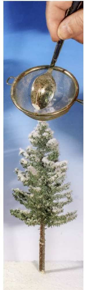
Krönung mit Noch-Schneeflocken.