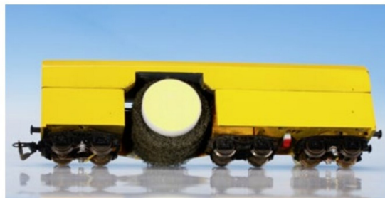
Zum Saugwagen kommt neu auch ein Polierwagen für H0m.