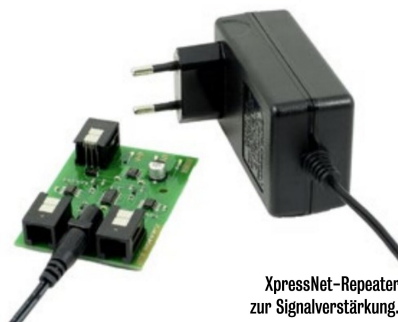
XpressNet-Repeater zur Signalverstärkung.

Die nächste Zentrale LZV200 befindet sich zurzeit in der Erprobungsphase, nicht nur im Giessener Labor sondern auch bei einigen Modellbahnnern, um sicherzustellen, dass sie den praktischen Bedürfnissen optimal entgegenkommt. Sie wird auch auf Selbstupdate-Fähigkeit hin vorbereitet. Für grosse Anlagen oder umfangreiche Modularrangements hat man einen XpressNet-Repeater entwickelt, der als Signalverstärker und -wiederholer Problemen mit Signalqualität und Stromversorgung entgegenwirkt.