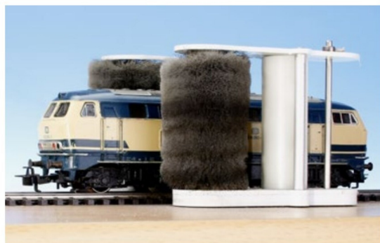
Trockenreinigungsanlage für H0-Fahrzeuge, später auch für andere Spuren.

Neu ist eine Entstaubungsanlage für Modellfahrzeuge, vorläufig für H0. Die Anlage funktioniert wie eine Waschanlage ohne Wasser und entfernt so den Staub der Modelle. Für andere Spuren wird auf später verströet.