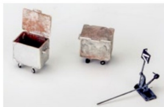
Abfallcontainer und Weichenstellattrappe.