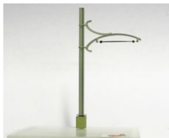
... ein nostalgischer für Nebenbahnen.