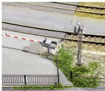
Die neue Schranke ist ein verstellbares Standmodell.

Abgerundet wird das Kleinteileangebot durch verschieden Tafeln und andere Details zur Ausrüstung von Masten im Bahnhofsbereich.