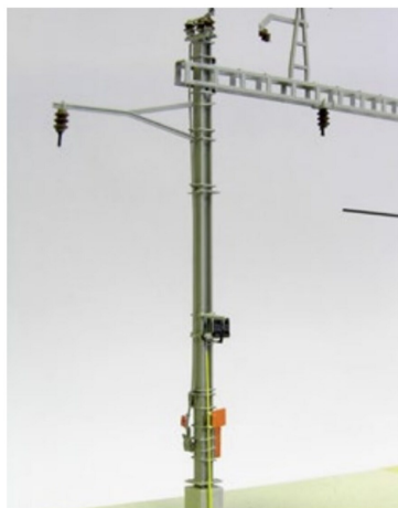
Markante Details zur Bestückung von Masten.