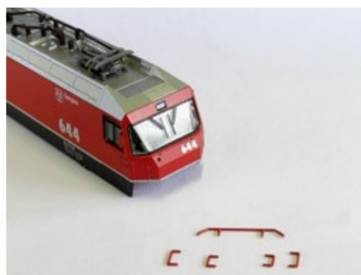
Griffstangen aus Neusilber für Ge 4/4 III von Kato.