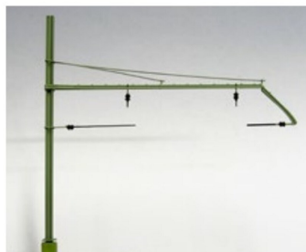
Ausleger für zweigleisige Hauptstrecken sowie ...