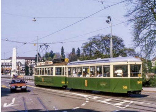
Berner Standardvielfalt. Der Zürcher B 711 verkehrte in Bern als B 341 und diente als Versuchsträger für die Drehgestelle der kommenden, neuen Vevey-Niederflurtriebwagen.