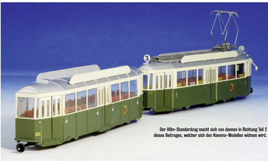
Der H0m-Standardzug macht sich von dannen in Richtung Teil 2 dieses Beitrages, welcher sich den Navemo-Modellen widmen wird.