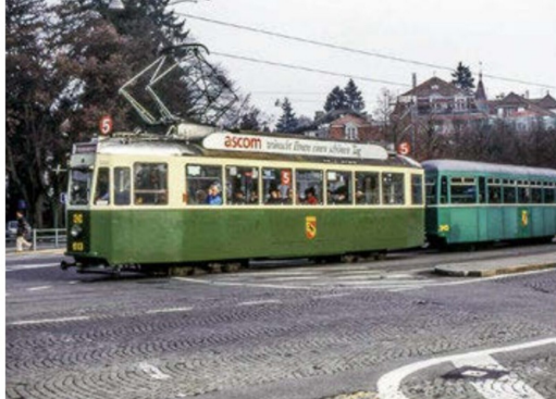
Auch von Basel waren Standard-Anhänger in Bern im Einsatz, allerdings ohne Anstrichänderung. Der B4 343 (ex BVB B4 1406) mit dem Be 4/4 613 auf dem Helvetiaplatz.