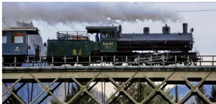
Adventzug vom 13. Dezember 2015 mit G 4/5 107 auf der Reichenauer Hinterrheinbrücke.