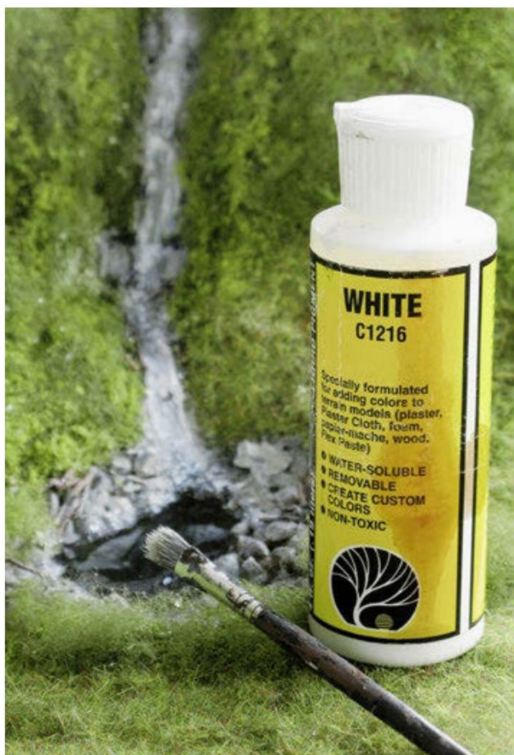
Um den Eindruck des schnell fallenden Wassers zu unterstreichen, kann mit der Farbe nachgeholfen werden.