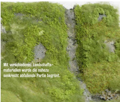
Mit verschiedenen Landschaftsmaterialien wurde die nahezu senkrecht abfallende Partie begrünt.