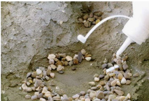
Kleine Steine als Felsbrocken wurden unten beim Wasserfall ins Bachbett gelegt und festgeklebt.