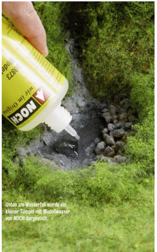
Unten am Wasserfall wurde ein kleiner Tümpel mit Modellwasser von NOCH dargestellt.