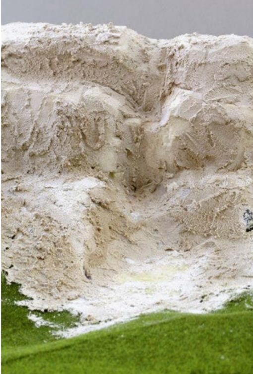
Der Untergrund eines steilen aber kleinen Wasserfalls. Modelliermasse von Busch wurde verwendet und wurde vollständig getrocknet.