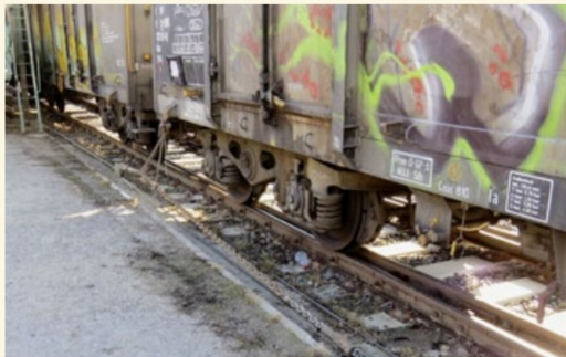
Dafür werden die Eaos an die Kette genommen und über Umlenkrolle und ...