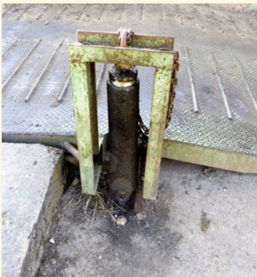
In früheren Jahren hatte der Hydraulikstempel wesentlich mehr zu tun.