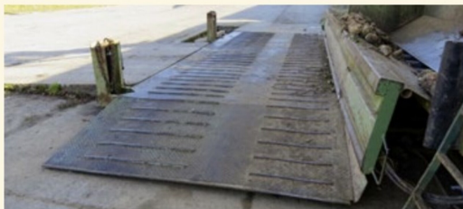
Die Kippvorrichtung steht jedoch bereit, um Rüben ins Rutschen zu bringen.