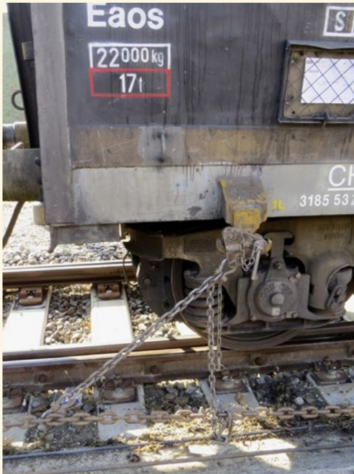
Die Wagen müssen ihrem Füllstand entsprechend vorgerückt werden.