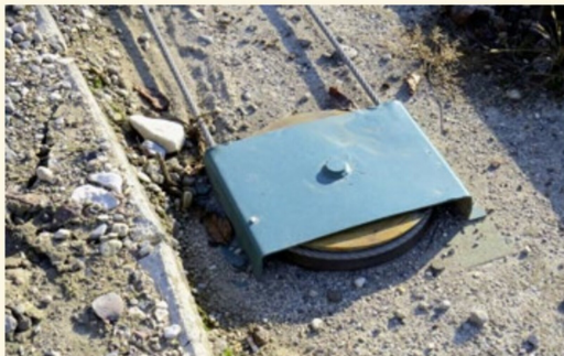
... Seilzug, dessen Antrieb sich in der Anlage befindet, vorgerückt.