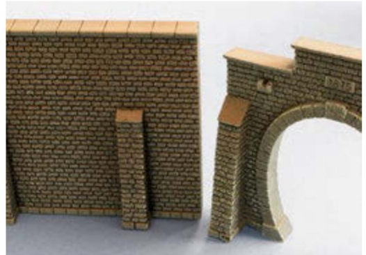
Tunnel und die passende Mauer aus Hartschaum aus dem Sortiment von NOCH.

Klebstoff am Trocknen ist, verwende ich lange Nadeln von Woodland Scenics, um die Teile in der richtigen Position zu halten und lasse das Ganze über Nacht trocknen. Dann ist nämlich auch der eventuell verarbeitete Weissleim ausgehärtet.