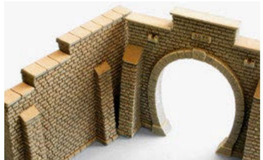
Mauer und Tunnelportal sind jetzt gleich hoch.