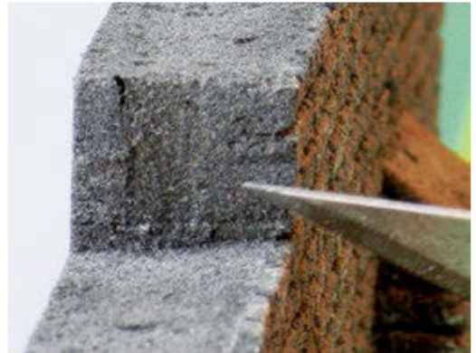
An den geschnittenen Seiten schneide ich die fehlenden Fugenritzen mit dem Messer ein.