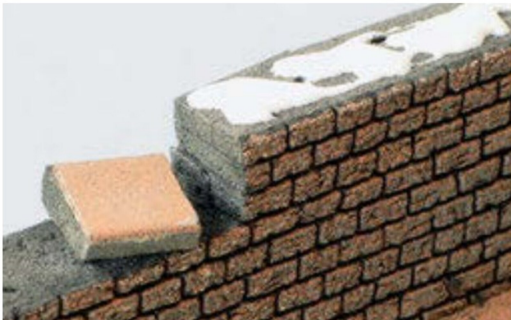
Die Abschlusssteine klebe ich mit Weissleim oben an der Mauer an.