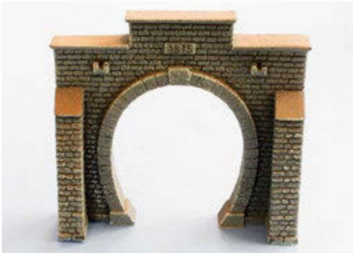
Dieses Tunnelportal von NOCH wird fertig eingefärbt geliefert und wurde aus Hartschaum hergestellt. Es gibt noch viele Mauerteile desselben Herstellers.