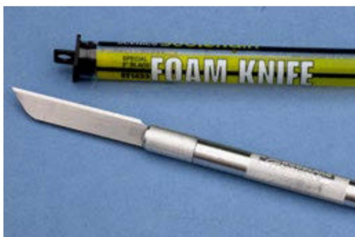
Das Woodland-Messer hat eine Schneide von 5 cm, mit der man gut tiefe Einschnitte ins Material machen kann.