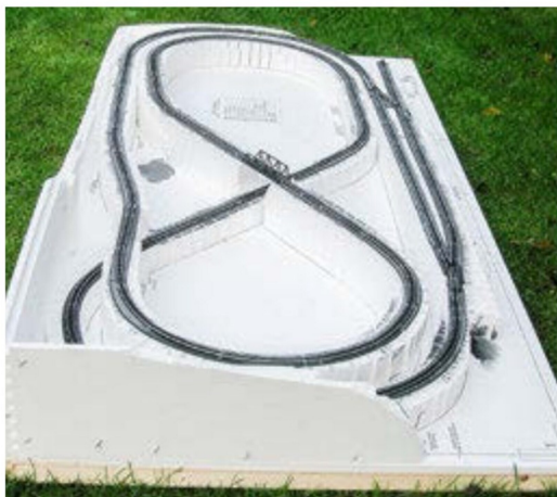
Eine N-Anlage von der Grösse 1 × 2 m, ausschliesslich mit Woodland-Material gebaut.