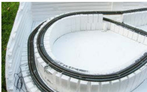
Ein Ausschnitt aus einer N-Anlage, die ausschliesslich aus Woodland-Material gebaut wurde.