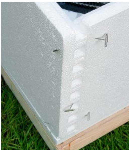
An den Ecken können die Woodland-Teile zusammen geklebt werden und während des Trocknens mit Woodland-Nadeln festgehalten werden.