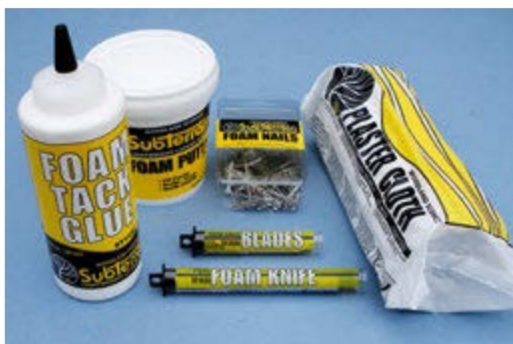
Woodland Scenics stellt eine grosse Anzahl von Werkzeugen und Klebstoffen für die Verarbeitung des Hartschaumes her.