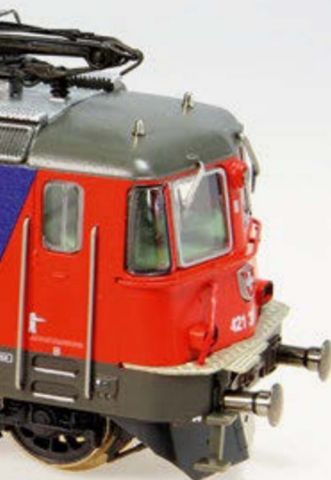
Die aktuelle Fleischmann Re 421 vor der «SB-Einfachherztransplantation».

ching gesandt werden. Dort wurde das Nötige auf einem modernen Maschinenpark präzise, zweckmässiger Weise auch gleich der komplette Umbau, erledigt.