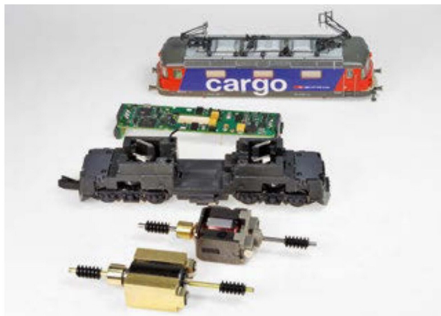
Der Aufwand für die Demontearbeiten hält sich in Grenzen.