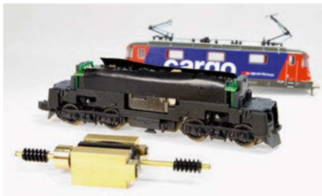
Der in die Lok passende Tauschsatz von sb-Modellbau liegt zur Montage bereit.

Wir wollen im nun folgenden Beitrag aufzeigen wie der Austausch von statten geht und ob dieser wirklich so einfach wie versprochen ist.