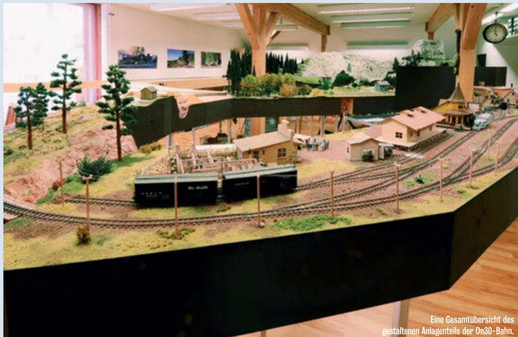
Eine Gesamtübersicht des gestalteten Anlagenteils der On30-Bahn.

Der Markt gibt inzwischen vieles für den Selbstbauer und den «Out-of-the-box»-Fahrer her. Doch Bachmann gibt nach wie vor den Takt an. Seine Startsets haben zudem einen sehr einsteigerfreundlichen Preis.