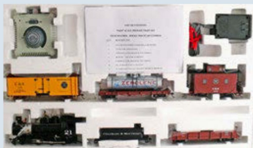
Das momentan lieferbare Bachmann On30-Startset «Rocky Mountain Express» kostet in den USA etwa 250 Dollars.