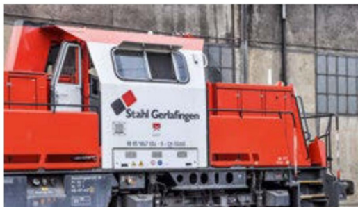
Der Wetterschutz oberhalb der Seitenfenster wurde nachträglich angebracht.