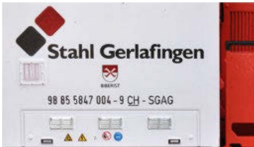
Dank sauberem, gestochen scharfem Druck der Anschriften am Führerhaus des Modells sind diese auch im kleinen mühelos lesbar.