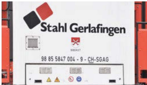
Die Seitenwände des Vorbild-Führerhauses werden geprägt vom Logo der Eigentümerin und dem Gemeindegewappen von Biberist.