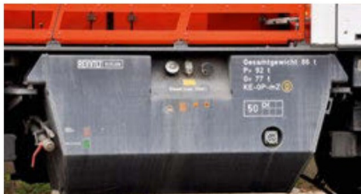
Technische Informationen auf dem seitlich angebrachten Dieseltank.