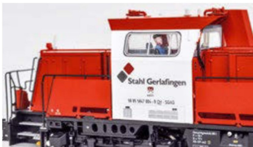
Das Modellführerhaus entspricht dem Ablieferungszustand im Frühjahr 2010.