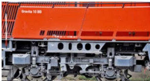
Robuste Drehgestellkonstruktion mit geschweisstem Rahmen aus H-Profilen prägen das Erscheinungsbild der Gravita entscheidend mit.