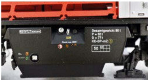
Auf dem dem Modelldieseltank fehlen keine Anschriften.