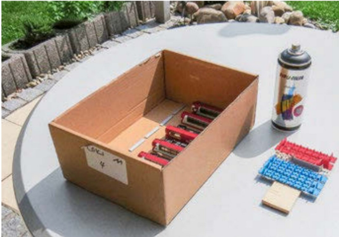
Ordnung ist das halbe Leben, auch beim Sprühen.