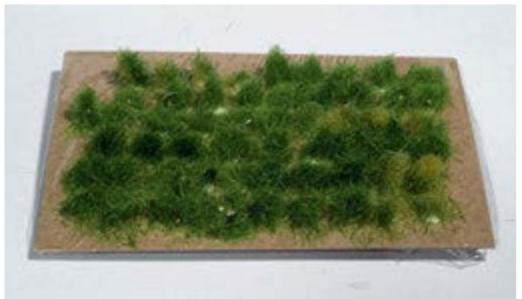
So setzt man Büschel für Büschel in den Leim.

Nach etwa zehn Minuten wenn der Leim etwas angetrocknet ist, können die losen Fasern abgesaugt werden.