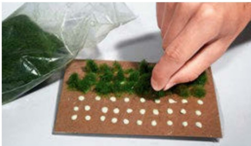
Diesen setzt man vorsichtig in einen Leimtupfen.