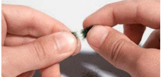
Mit Daumen und Zeigefinger der anderen Hand zupft man sich mit viel Fingerspitzengefühl einen Büschel Grasfasern heraus, dessen Fasern nun alle mehrheitlich parallel zueinander verlaufen sollten.