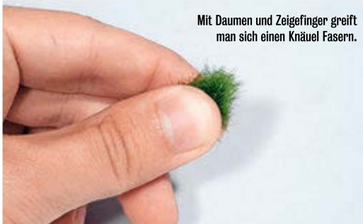
Mit Daumen und Zeigefinger greift man sich einen Knäuel Fasern.