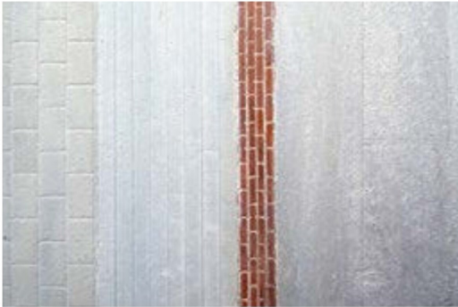
Ein Probestück mit unterschiedlichen Texturen.