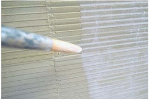
Das Auftragen von hellen Lasuren ...