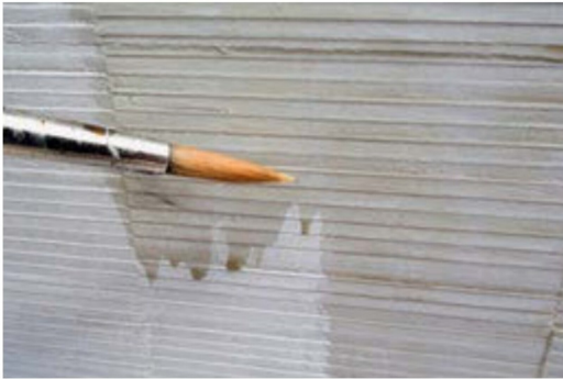
... und abschliessendes «Washing» erfolgt hier mittels ...