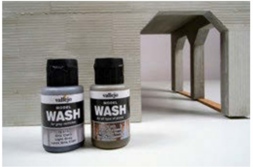
... speziellen, verdünnten Farben, beispielsweise von Vallejo.