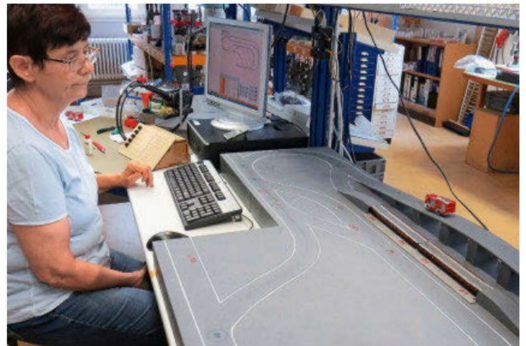
Eingehende Testfahrt auf «Funktion, Herz und Nieren».