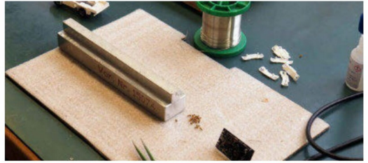
... für die hochstehende Qualität der Fahrzeuge.

reibungslos funktionierenden Produkt haben. Die hohe Wertigkeit der Produkte wird auch nach aussen mit hochwertigen, sehr ansprechenden Verpackungen signalisiert. Innen sorgen feinporige Schaumstoffeinlagen für ein sicheres Ankommen der Modelle und Komponenten beim Kunden. Wieviel an Herzblut generell dahintersteckt durften wir von der LOKI bei der Teilnahme an einer der Händlerschulungen in eigener Anschauung erleben. Wir haben im wahrsten Sinne des Wortes «erfahren», dass das Car System Digital 3.0 reibungslos funktioniert und alle Beteiligten hatten eine grosse Menge an Bestätigung sowie auch Spass dabei.