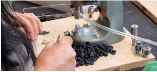
Speziell geschulte Mitarbeiter(innen) sorgen ...