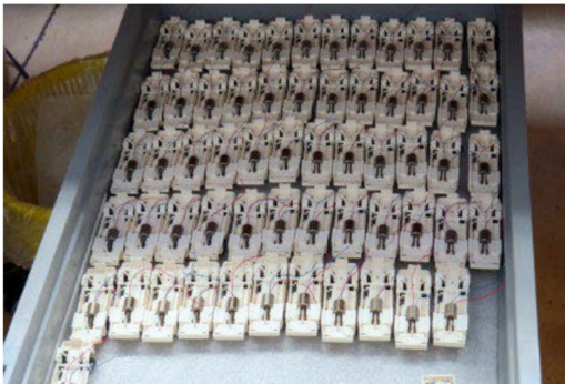
Speziell gefertigte Chassis für die MAN-Feuerwehr.

Immer präsent und damit äusserliches Erkennungsmerkmal ist die Ultraschallkapsel, die sich aus dem jeweiligen Fahrzeug heraus gen Himmel reckt. Faller hat für diesen Zweck schon die kleinste Bauform in der für diese Anwendung erforderlichen Qualität gewählt. Das Bauteil ist für das System «lebensnotwendig» und darf nicht mechanisch abgedeckt werden. Technikfreaks