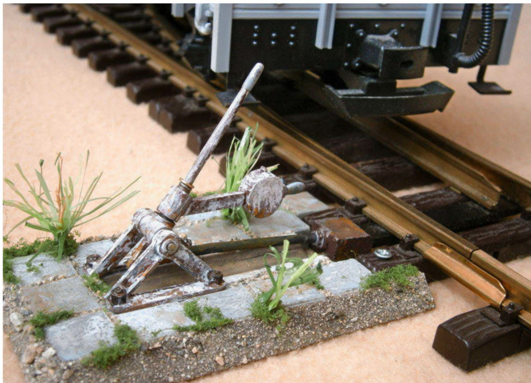
Nach Montage und farblicher Behandlung darf der Modellbauer stolz auf einen zwar aufwändigen, aber erfolgreichen Prozess zurückblicken.