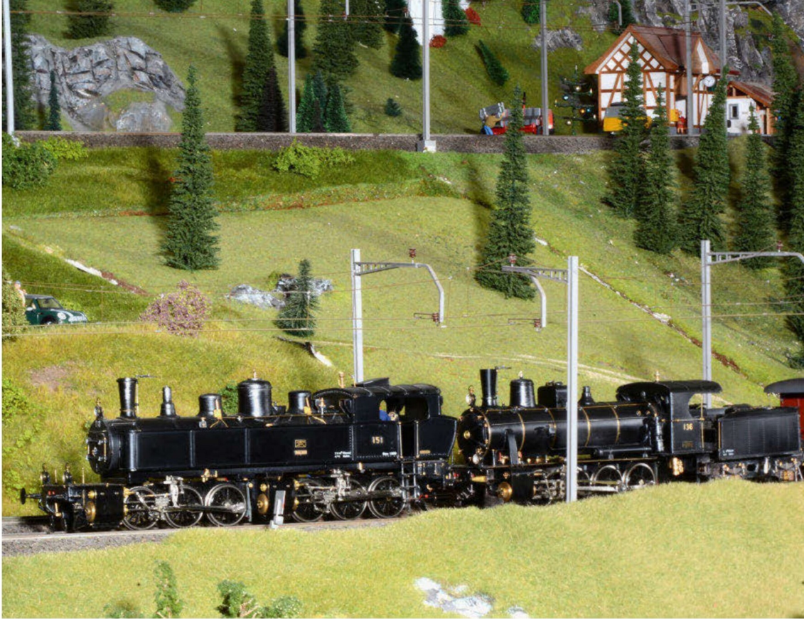
Welch fantastische Zugformation: Die GB Ed 2 x 3/3 leistet der D 4/4 Vorspann. Besonders originell ist der Personenzug, den sie befördern. Einzelne Wagen verfügen über