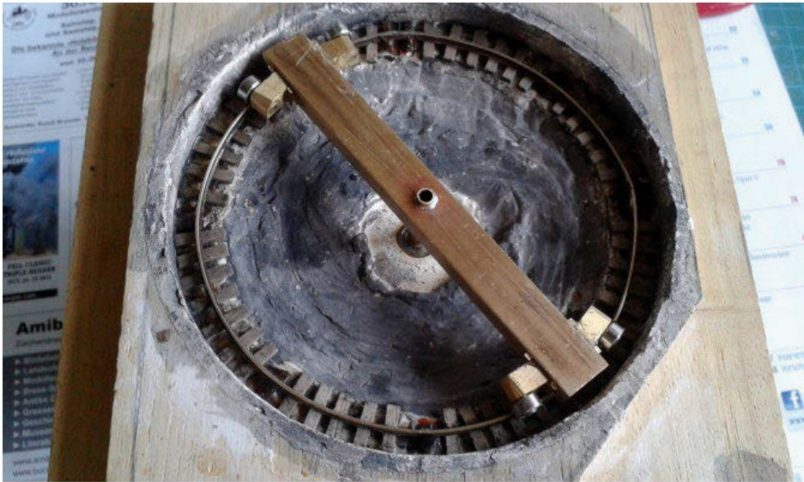
Der Grundkörper beim ersten Funktionstest.