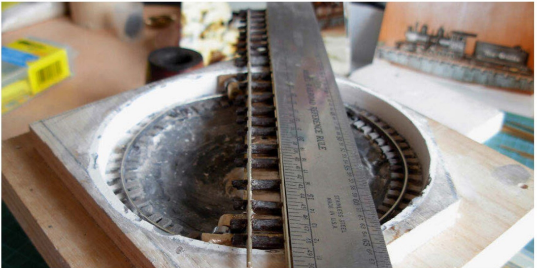
Mit Hilfe eines Stahllineals wird das Bühnengleis ausgerichtet, grob abgelängt und nach dem Anbringen der Seitenteile aufgeklebt.