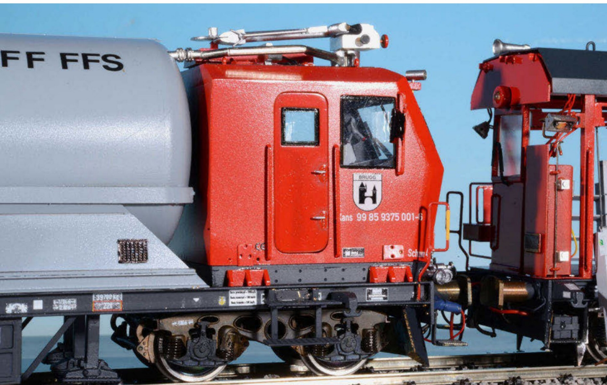
Übergang vom Tanklöschwagen zum Rettungswagen. Der Tanklöschwagen könnte eisenbahntechnisch als Steuerwagen bezeichnet werden. Von ihm aus kann der Geräte