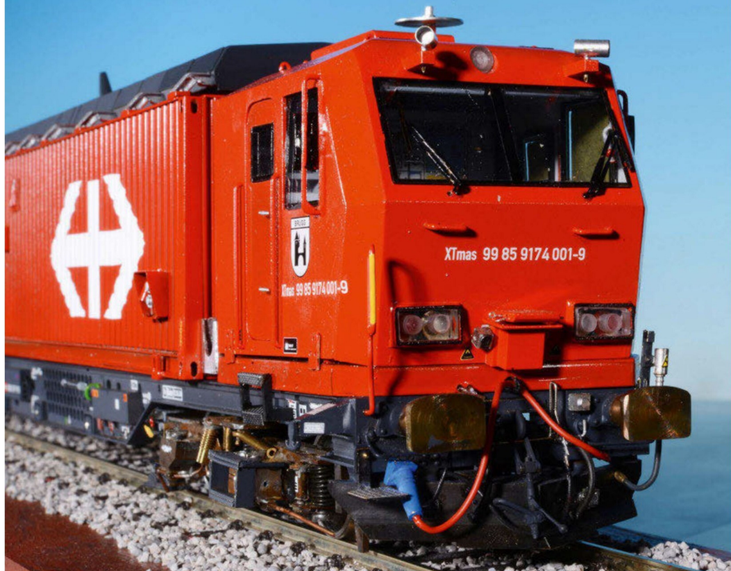
Frontpartie des Rettungswagens, der selbständig verkehren kann, also eher eine Lok als einen Wagen darstellt.