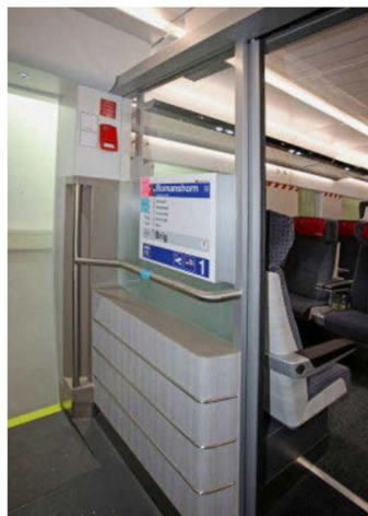
Eingangsbereich in einem Erstklasswagen.