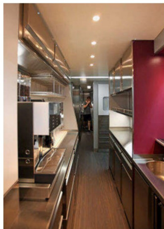
Blick in die Küche des Restaurantwagens.