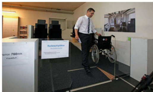
Demonstration der behindertengerechten Einstiege und Zugang zu den Abteilen.