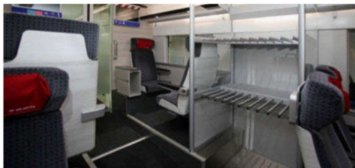
Gepäckablagen im Erstklasseabteil.