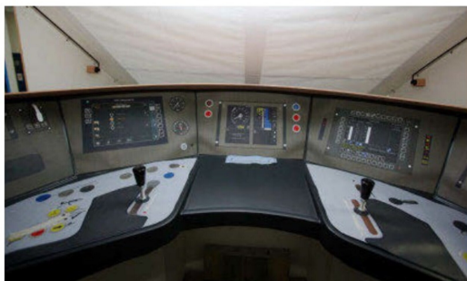
Führertisch im Führerstand.