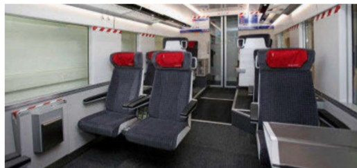
Blick in ein Erstklasseabteil.

zuzulassenden Triebzüge dürften erst bei Eröffnung des Ceneri-Basistunnels 2019 in genügender Stückzahl zur Verfügung stehen, dann aber die Strecke etwa von Zürich nach Milano in weniger als 3 Stunden meis-tern können. Pd