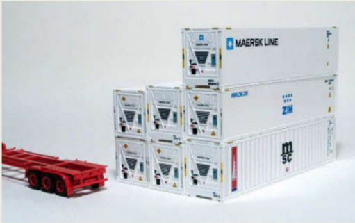
Bild 13 «Reefer» im H0-Massstab mit Kühlaggregat von «Thermo King».