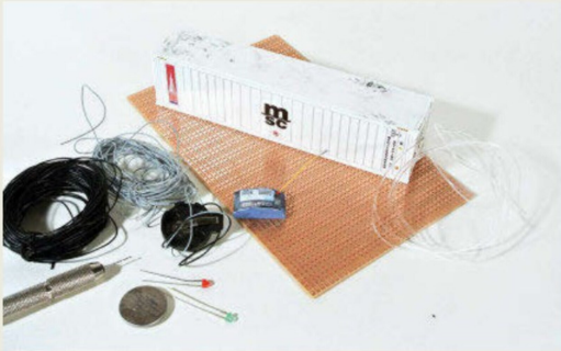
Bild 15 Bauteile zur Realisierung der Beleuchtung der Anzeigen.