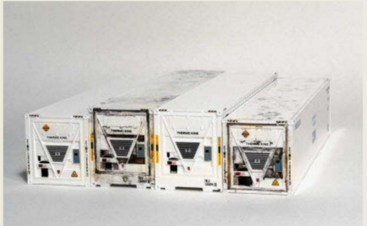
Bild 14 Erste Spuren von Patina am Kühlaggregat.