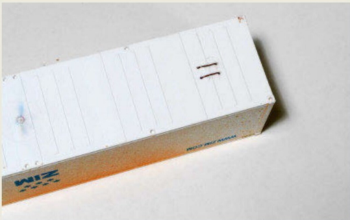
Bild 17 Stromkreisunterbrechung am Boden des Containers.