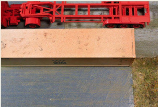
Bild 19 Gleiches im Terminal.