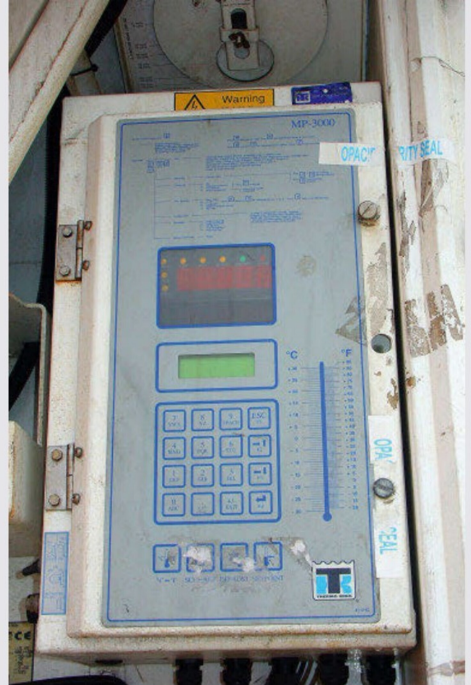
Bild 7 Kontrolleinrichtung MP 3000 mit Tastatur am Kühlaggregat. Man beachte die Umrechnungsliste °Celsius mit Fahrenheit.