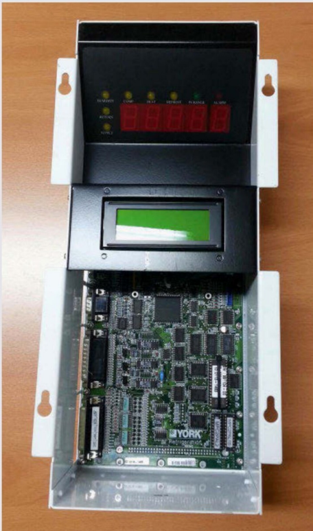
Bild 8 Farbfrikneuer «Controller» MP 3000. Inzwischen wird die weiterentwickelte Version MP 4000 verwendet.