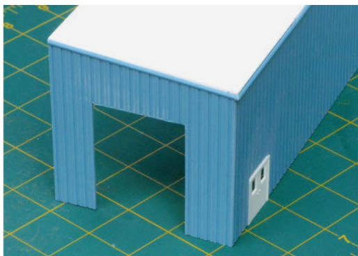
Die beinahe fertige Verladestelle mit der Torpartie für die Einfahrt der zu be- oder entladenden Eisenbahnwagen.