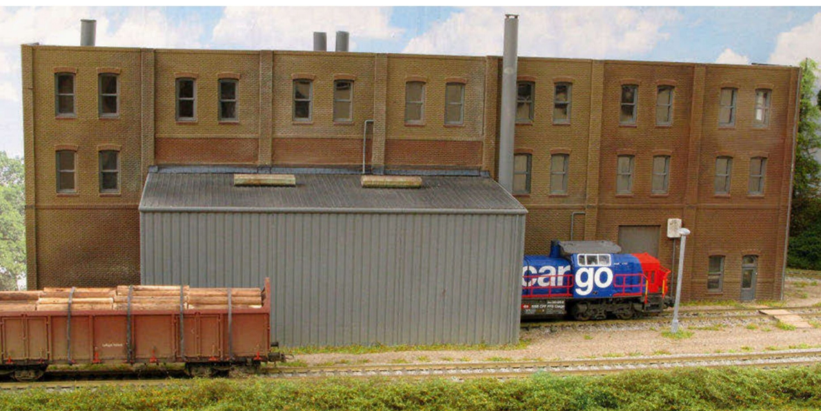
Gesamtüberblick über die Szenerie der Güterumschlaganlage mit dem Gewerbebau.