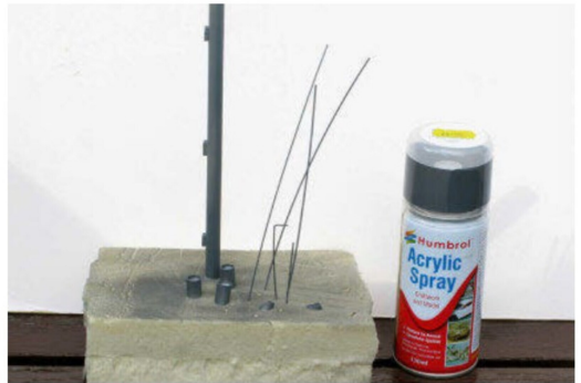
Dachrinnen und Kamine wurden aus Material von Evergreen gemacht und während der Farbgebung mit Farbspray auf ein Kunststoffstück gesteckt.