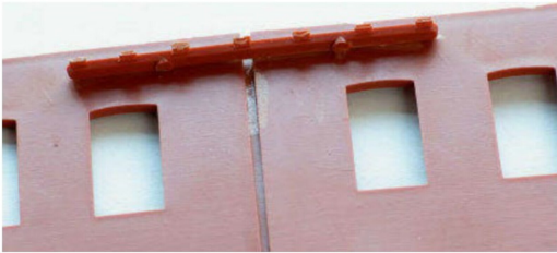
Um die Wandteile sicher zusammenzufügen, werden sie innen mit übrig gebliebenen Kunststoffteilen verklebt, um die Wände zu verstärken.