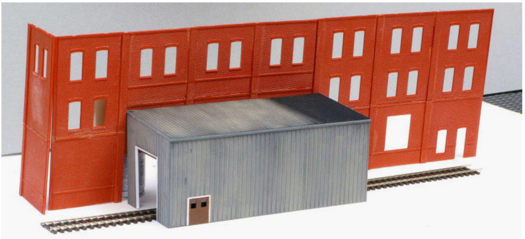
Zur besseren Vorstellung und zu Testzwecken wurden die Mauern zuerst einmal provisorisch zusammengestellt.