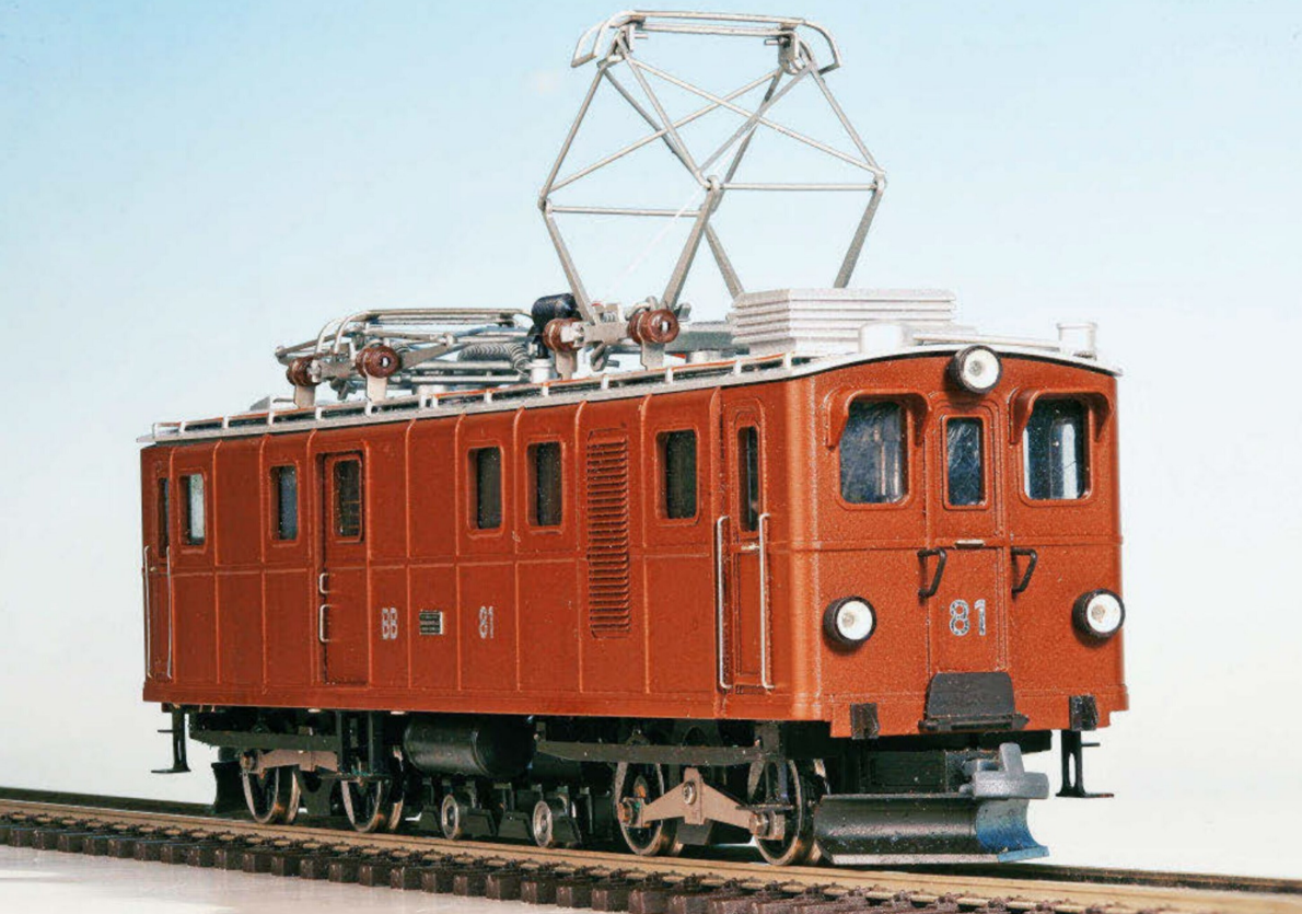
Charles Albissers jüngstes Lokprojekt hat eigentlich zwei Vorbilder: Ge 6/6 Nr. 81 wurde 1929 zur Ge 4/4 umgebaut. Im Modell realisiert hat er beide Varianten.