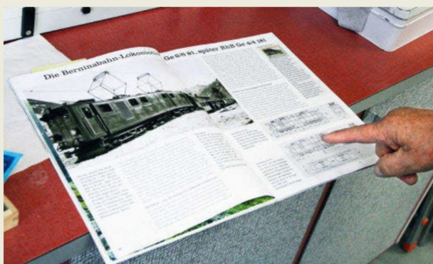
Bei der Suche nach einem Vorbild war schnell klar: Diese muss es sein!