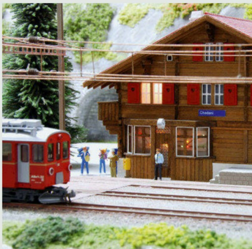
Chadani an der RhB. Im Namen sind unschwer Charles und Daniel zu erraten.