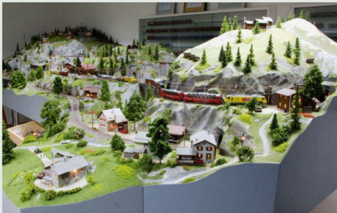
Beim Sohn wurde erfolgreich das Modellbahnfeuer gezündet: Vater-Sohn-Anlage mit Bündner Bezug.