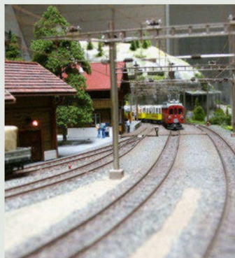
Chadani ist der Betriebsmittelpunkt der Anlage.