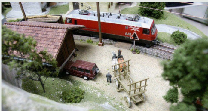
Landwirtschaftliche Anwesen sind dankbare Themen für den Gebäudemodellbau. Auch bei Albissers.