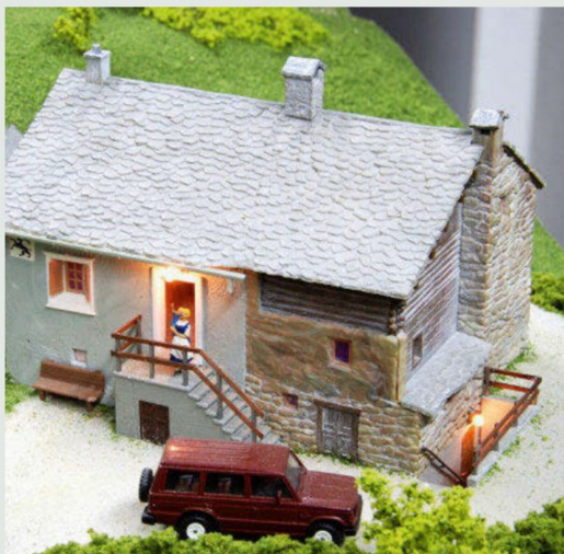
Für die Anlage baute Charles Albisser zahlreiche stimmige Gebäudemodelle.