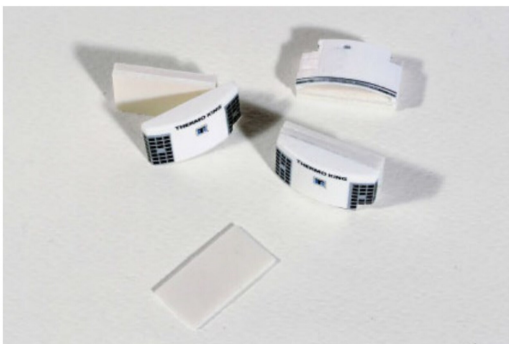
Bild 24 Drei Millimeter Material müssen hinzugefügt werden.