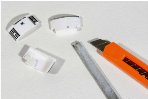
Bild 23 Füllstücke verschliessen die Öffnungen.