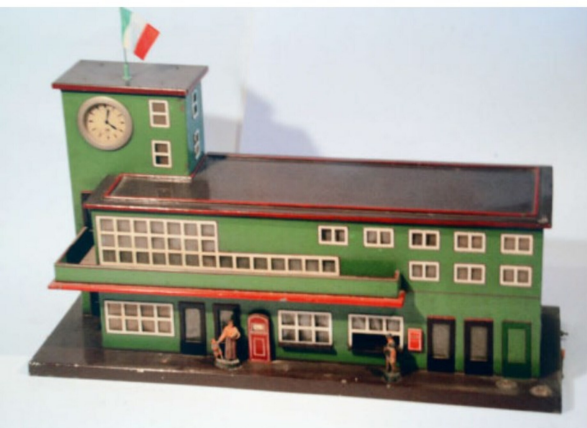
Bahnhöfe aus Blech gehörten zum Standardzubehör.