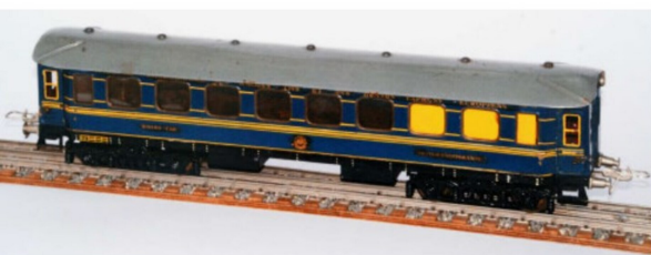
Erste CIWL-Wagen noch in Tinplate-Ausführung.