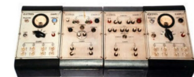
Elektrische Steuerkomponenten von Elettren.