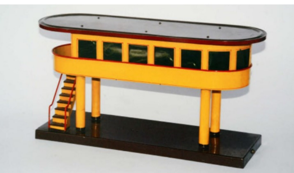
Ein damals «modernes» Stellwerk aus dem Hause Elettren.