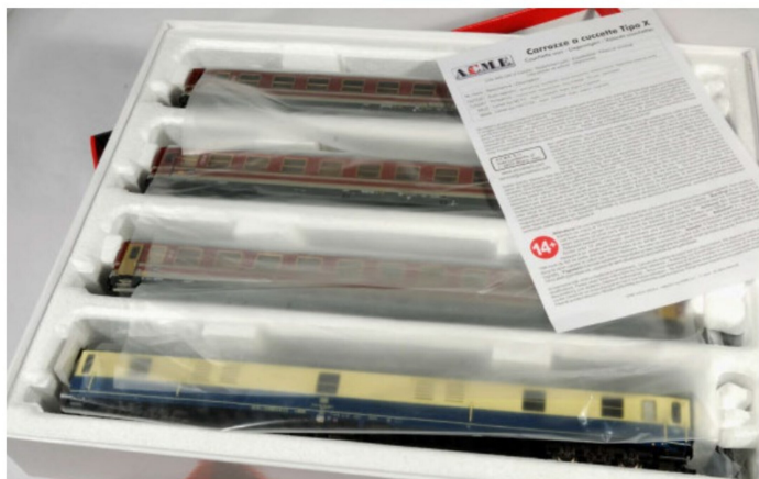
Bild 7 Offene Verpackung.