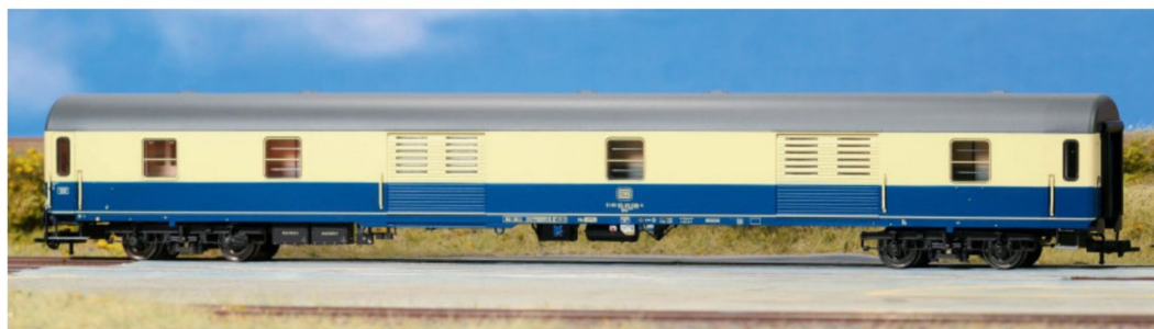
Bilder 8 + 9 Die beiden Seiten des Dms 905.0 51 80 95-80 098-4.