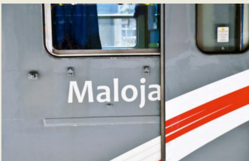
Zumindest diese Wagenanschrift erinnert an das einstige Projekt.

getroffen und wird in Bälde die Rückfahrt antreten. Diese führt über einen grossen Bogen zum Tunnelportal und über eine Wendel und einen sichtbaren Streckenteil zum Niveau der Abstellgleise Lecco resp. Milano, die sich aus Zugriffsgründen etwa 20 cm unter der Stazione Chiavenna befinden. Diese Abstellgruppe ist zeichnerisch nicht dargestellt. Ihre Konfiguration kann den persönlichen Bedürfnissen angepasst werden. Die Umkehrschleife ist in der Zeichnung oben links angedeutet. Als Alternative kann die Wendeschleife auch im Wendebereich der Bergeller Bahn positioniert werden. Ein nicht vorbildgerechter Sichtbereich unterhalb der RhB-Strecke sorgt jedoch für ein weiteres FS-Feeling.