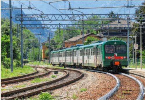
Automotrice elettrica Le 662-040 bei der Einfahrt in Chiavenna.