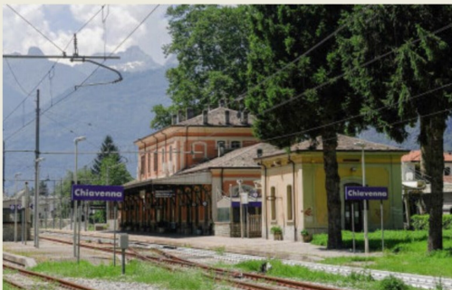
... auch vom traditionellen südländische Flair ist noch genügend vorhanden.