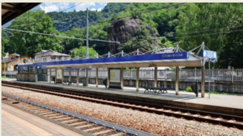
Bauten mit dem für Italien nicht untypischen, modernen Design, aber ...