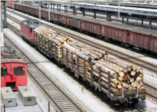
Re 4/4 II mit einem SnpS (hinter der Lok) und einem Sps mit Holzladungen im Bahnhof Spiez.