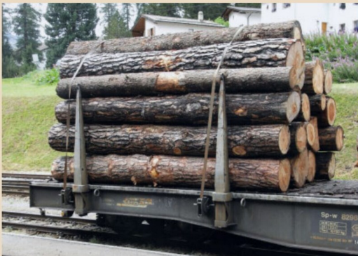
Detail des Rungenwagens Sp-w der RhB in Samedan im April 2007.