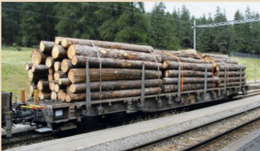
Die Rhätische Bahn transportiert grosse Mengen von Holzstämmen auf ihrem Meterspurnetz.