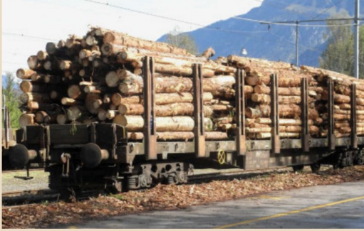
Ein mit Holz beladener Sps der SBB in Interlaken-Ost im Juni 2009. Man beachte die beim Beladen herabgefallenen Rindenstücke neben dem Gleis.