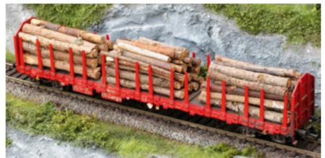
Der Roos von Piko beladen mit kurzen Holzstämmen, die mit Weissleim zusammengeklebt wurden. Die Sicherungsbänder oben warten noch auf die Bearbeitung.