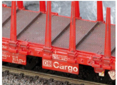
Bereits nach der neuen Farbgebung des Wagenbodens mit grauer Farbe und leichter Verwitterung des Aufbaus sieht der Wagen viel vorbildrichtiger aus. Logo und Beschriftungen wurden sofort wieder mit dem Glaspinsel etwas nachbearbeitet. Richtige Holztransportwagen die sehr oft im Einsatz stehen, sehen rasch gebraucht aus mit dem dauernden Be- und Entladen der meist schmutzigen Baumstämme.