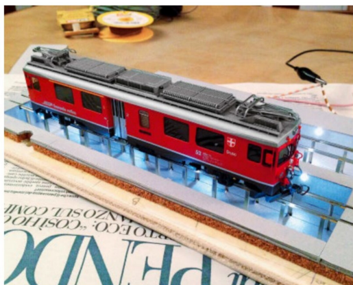
Ein Teil der beiden Hallengleise ist jeweils aufgeständert.