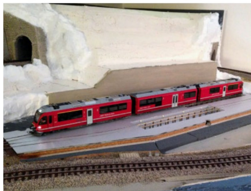
Natürlich muss auch ein Allegra im Deposito Platz haben.