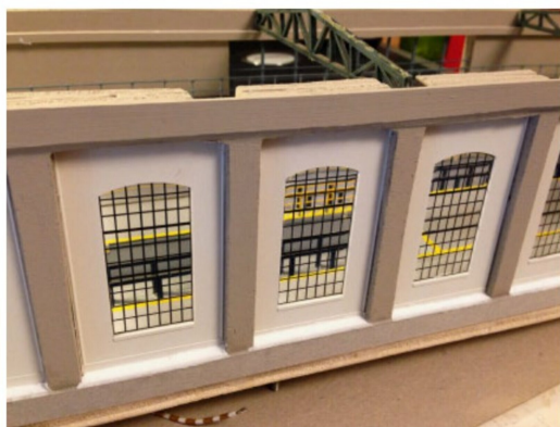
Aus dem Erzgebirge wurden die Auhagen-Hallenfenster geliefert.